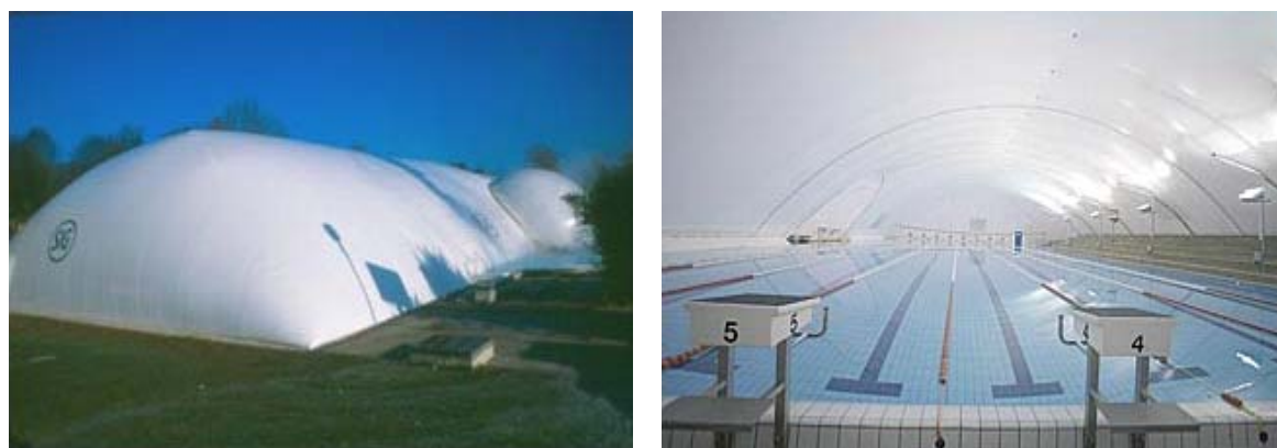
Fig. 1: Couverture bassin de natation à Schaffhouse (long. 58 m, larg. 28 m, coûts env. ½ mio. CHF) 1,2

Il est possible de recouvrir pendant l'hiver des installations sportives existantes, telles que des piscines à ciel ouvert ou des courts de tennis, par une halle gonflable amovible. La halle est mise en place en automne et enlevée au printemps. Cette solution est relativement bon marché et permet d'exploiter les installations pendant toute l'année. Les constructions recouvertes d'une telle membrane consomment cependant beaucoup d'énergie, raison pour laquelle la présente recommandation a été conçue. Ce document s'intéresse particulièrement aux piscines, car les besoins en énergie sont bien plus élevés que pour les courts de tennis.