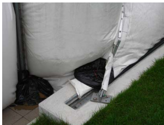
Fig. 2: Ancrage linéaire des membranes.

En règle générale, une nouvelle fondation en béton doit être construite afin de réduire les déperditions de chaleur par la fondation. Il faut intégrer, entre le socle intérieur et le socle extérieur de fondation, une isolation périphérique allant jusqu'à 1 m de profondeur. Un tel dispositif permet de réduire les flux de chaleur au niveau du terrain (pour le calcul, cf. norme EN 13370).