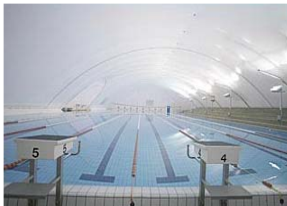
Abb. 1: Überdachung Schwimmbecken (Länge 58 m, Breite 28 m, Schaffhausen, Kosten ca. ½ Mio. CHF) 1,2